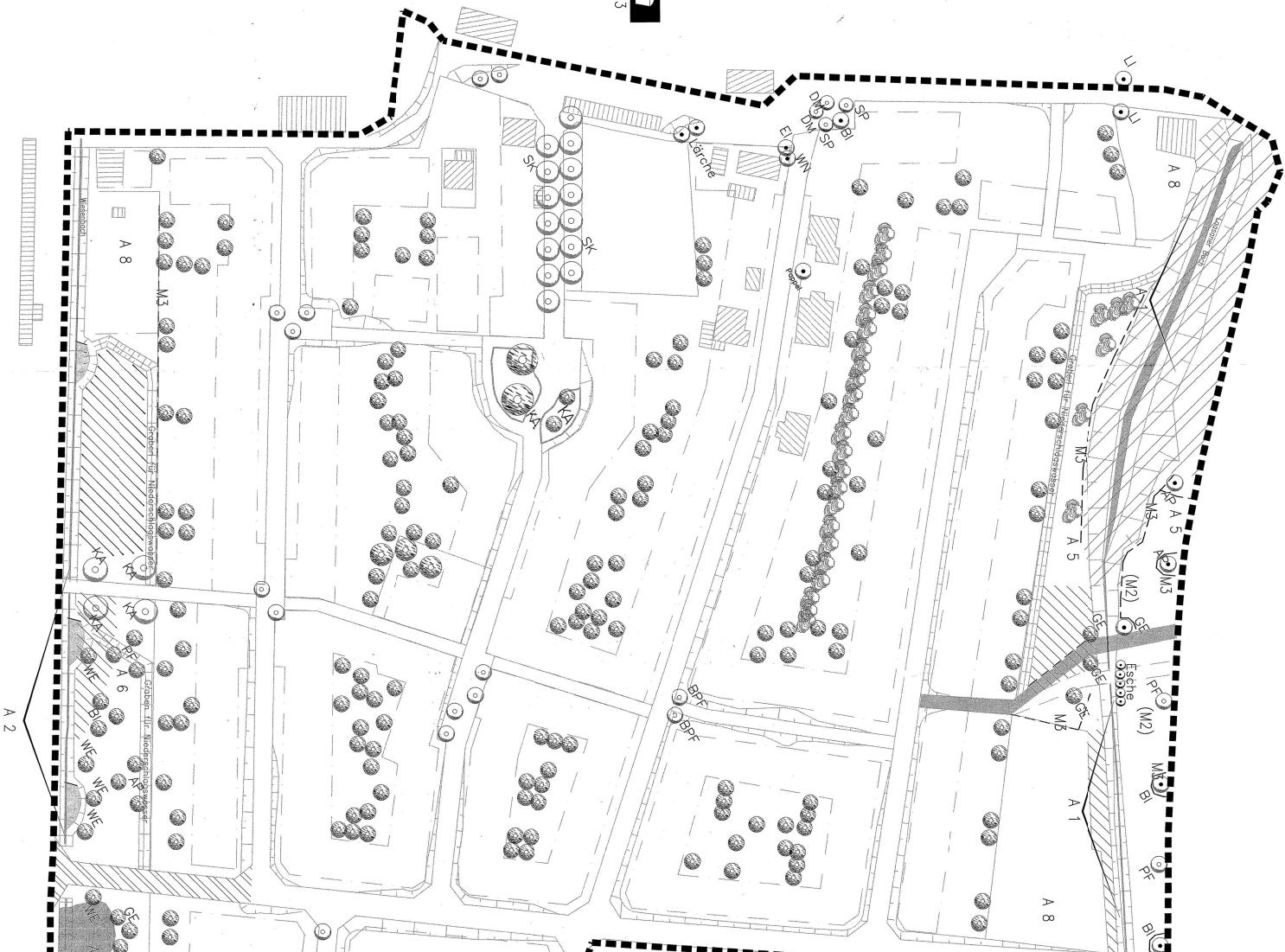
Anschluß an Plan zum Zweiten Geltungsbereich (Karte 3)